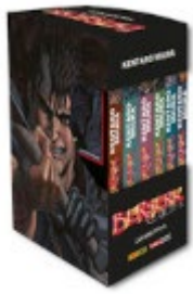
Immagine della copertina non limitata alla prima o alla quarta, in prospettiva 3D