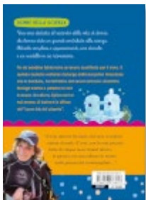
Immagine in 2D della copertina posteriore.