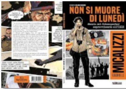
Immagine della copertina comprensiva della prima, della quarta, del dorso e, se presenti, dei risvolti di copertina